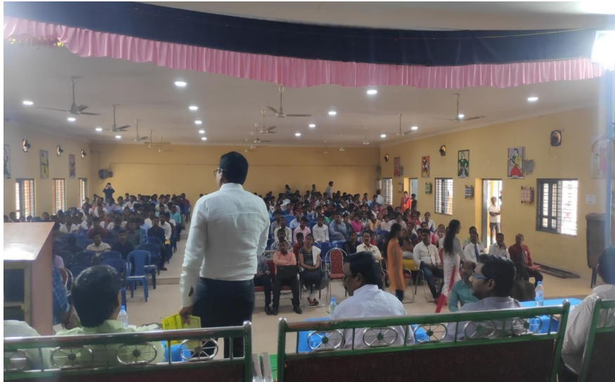
Inaugural Function: Filled with crowd.