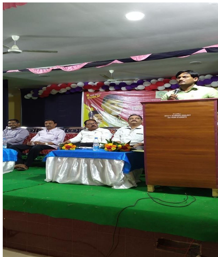
Speech of JKC Coordinator at Inaugural Function